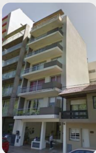
EDIFICIO PLAZA MALVINAS -Calle 50 n° 1237-