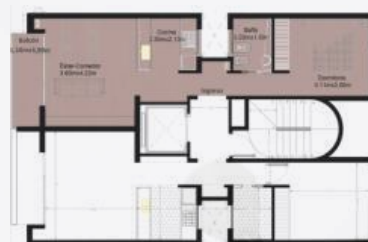
Ubicación en planta

! Imágenes ilustrativas, las características específicas pueden variar