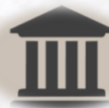
Zona de universidades y oficinas