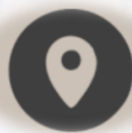
Fácil acceso a principales puntos de interés