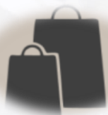
Centro Comercial Calle 12

Situado en calle 61 n° 709 entre 9 y 10 de la ciudad de La Plata, se caracteriza por su ubicación céntrica, encontrándose a pocos metros del centro comercial calle 12, y a numerosos edificios de oficinas y universidades públicas. Su cercanía a las avenidas 7 y 60, permite un fácil acceso a la totalidad de los puntos de interés de nuestra ciudad.