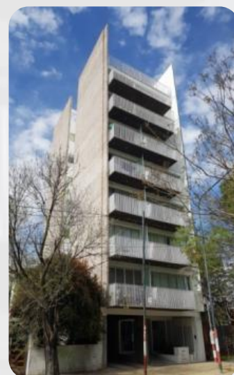
EDIFICIO PARQUE SAAVEDRA -Calle 12 n° 1670-