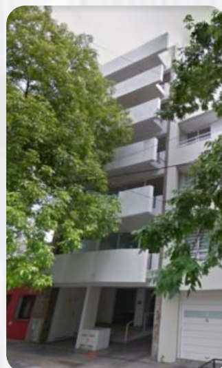
EDIFICIO 39 -Calle 39 n° 691-