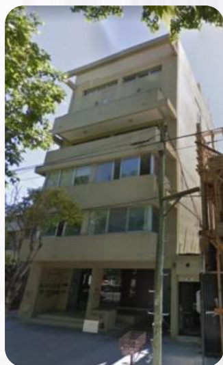
EDIFICIO 51 -Calle 51 n° 1363-

Segunda generación de un negocio familiar con más de quince años de experiencia en la construcción de edificios. A la fecha contamos con más de cien unidades funcionales entregadas, en diez emprendimientos constructivos finalizados.