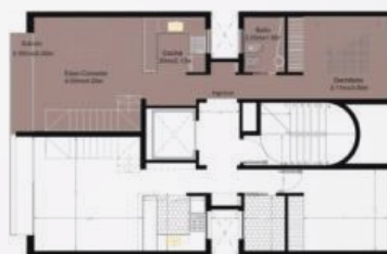
Ubicación en planta

! Imágenes ilustrativas, las características específicas pueden variar