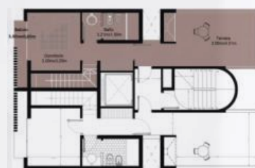
Ubicación en planta

! Imágenes ilustrativas, las características específicas pueden variar